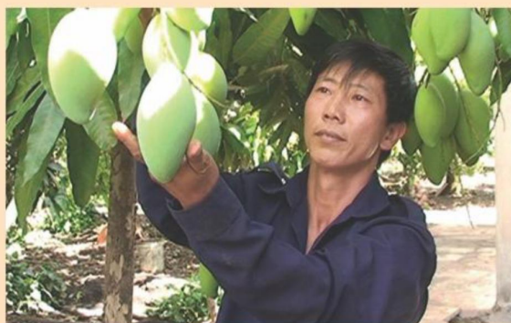
Cây xoài - Một trong những cây ăn quả Chủ lực của tỉnh Hậu Giang

Năm 2013 tập trung cho tái cơ cấu ngành Nông nghiệp và Phát triển nông thôn theo hướng chất lượng- Hiệu quả - Bền vững; Trọng tâm điều chỉnh qui trình sản xuất khép kín các cây con chủ lực; củng cố tổ chức bộ máy; hoàn thành các chỉ tiêu, nâng cao đời sống nông dân theo hướng nông thôn mới”.